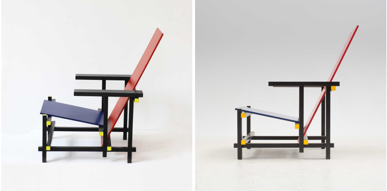
그림 3 위 그림처럼 <그림 1>을 응시자가 머릿속으로 제시된 의자를 돌려 볼 수 있다면 좀 더 풍부한 조형 요소와 조형 원리를 추출해 설명할 수 있음