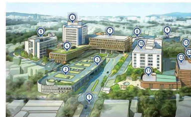
원주연세의료원 강원도 원주시 일산로 20