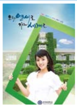
COVER STORY 2008년 미스코리아 미 장윤희(문대학 영아영문학과06 학번)