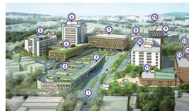
원주연세의료원 강원특별자치도 원주시 일산로 20