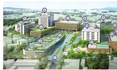
원주연세의료원 강원도 원주시 말산로 20