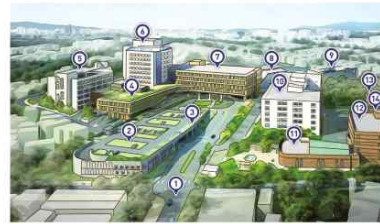
원주연세의료원 강원도 원주시 말산로 20