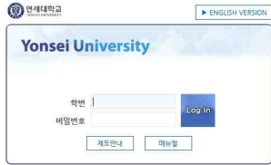
- 2017학년도 1학기 수강신청 안내 -